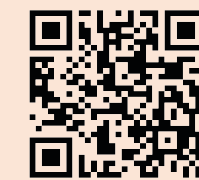
ひなた保育園 (インスタグラム)