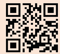
ひなた保育園 (ホームページ)